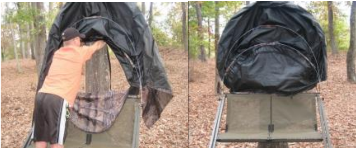
(Illustration 3) (Illustration 4)

L'affût doit maintenant être positionné comme indiqué sur l'illustration 3.