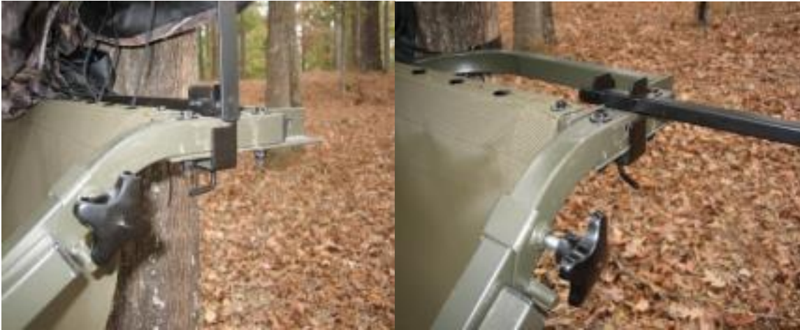
(Illustration 1) (Illustration 2)

ÉTAPE 1 : En cas d'utilisation avec les supports doubles L-200 et L-220, fixez-les au support à l'aide des supports fournis, comme indiqué sur l'illustration 1. En cas d'utilisation avec les supports simples L-100 et L-110, positionnez le collier comme indiqué sur l'illustration 2.